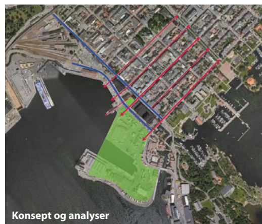
Konsept og analyser